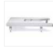
Table d'extension extra-large Pour manier facilement les tissus. Pratique pour le quilting et les projets de grande taille.

Kit pour travail à la canette Réalisez des coutures "à l'envers" (avec l'envers du tissu orienté vers le haut) en utilisant des fils décoratifs spéciaux trop gros pour le chas de l'aiguille.