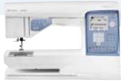
SAPHIRE™ 875 QUILT